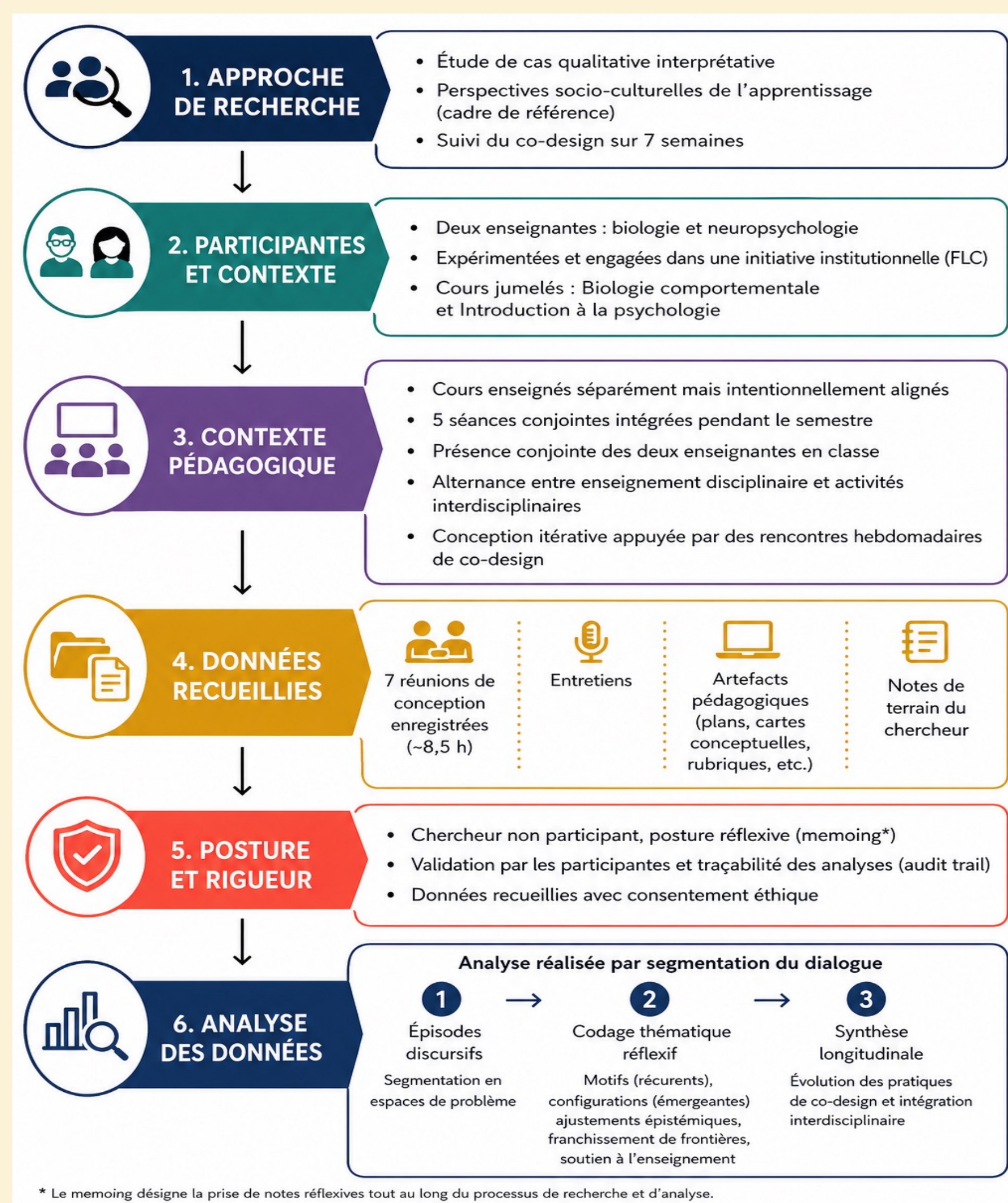
Figure 1. Résumé des méthodes de l'étude, ancré dans un cadre socio-culturel de l'apprentissage.